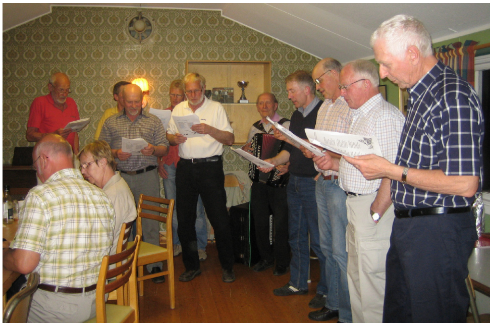
Drängarnas årliga framträdande.

Ett tillfälle att träffas under trevlig samvaro går under namnet "Bowlingfesten". I år ägde den rum fredagen den 1 maj. Drygt 20 personer, både bowlingspelare och andra, samlades vi 19-tiden i bygdegården för att avsluta bowlingsäsongen.