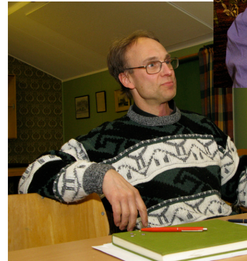
Sune berättar om TV-s intåg i våra hem.

Verksamhetsberättelse upplästes där det anmärktes att tipspromenaden var en givande tillställning. En sådan skulle även bli detta år.