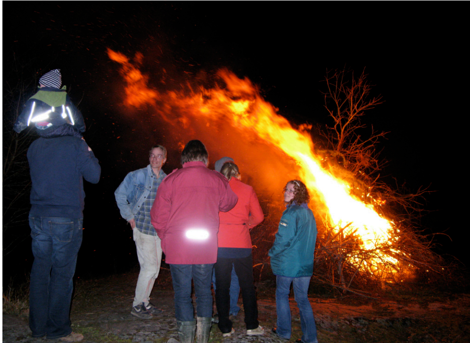
Påskelden tog sig bra i år.

Årets påskväder var det bästa tänkbara, varmt och soligt. Även på påskaftons kväll var det ljummet och det blåste en stilla vind som hjälpte elden att ta fart, så den lyste vida omkring. Ett trettiotal personer, Bråttensbybor såväl som tillresta gäster, samlades på Ekeberget och beskådade brasan. En och annan raket sköts också upp. Ekeberget är en bra utkikspunkt för att kunna se påskeldarna runtomkring, men i år var det inte många som eldade. Kanske var man orolig för brandfaran. Ett nytt inslag i påskeldstraditionen var att vi, på ungdomarnas initiativ,