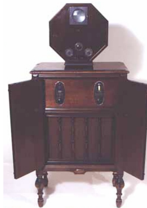
Denna bild på en tidig TV betecknas: 1928 GE "Octagon" . Det verkar vara en mycket liten bildruta på denna TV.