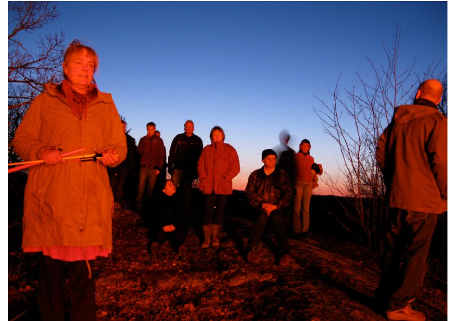
Några av besökarna i eldens sken.